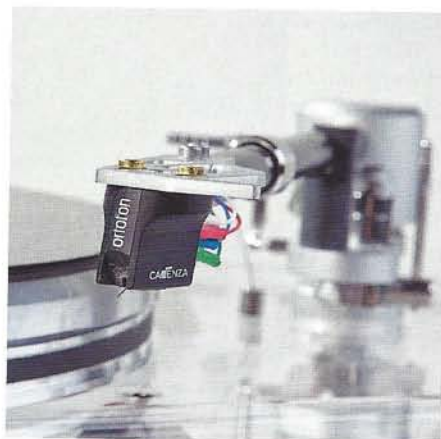
Vi testade spelaren mestadels med Orotons finfina MC-pickup Cadenza Black.

En lika lyckad konstruktion sett till ljudet som handhavandet och utseendet: bland det tjugigaste vi haft på redaktionen!