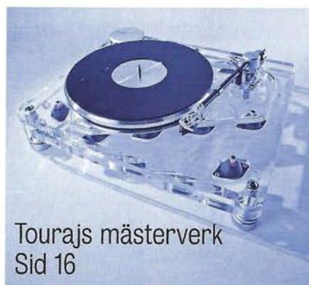
Tourajs mästerverk Sid 16