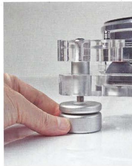
Spelaren står på tre, individuellt justerbara fötter med en liten kula mot underlaget.

Ge spelaren ett stabilt underlag som en väggmonterad hylla och du kommer att tycka att till och med högupplöst digitalljud kan börja verka livlöst och oengagerade enformigt. Ja, en vanligtvis sansad, lite återhållen pickup som Ortofon Cadenza Black (H&M nr 4/2014) blir med ens färgstark och blixtrande högexplosiv då Vertere-spelaren kopplar greppet om närlörelserna. Här finns nämligen inget av det lättviktiga ljud man annars ofta förknippar med 1-punktstlagrade armar. Tvärtom kan man börja upptäcka helt nytt basinnehåll i skivorna. Ja,