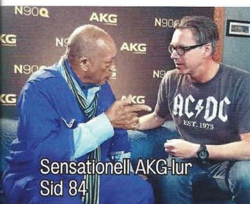
Sensationell AKG-lur Sid 84