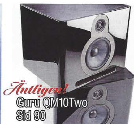
Äntligen! Guru QM10Two Sid 90