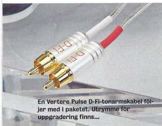
En Vertere Pulse D-Fi-tonarmskabel följer med i paketet. Utrymme för uppgradering finns...

Ett svindlande pris, men också en tonarm i Formel 1-klass som alla som hört (inklusive undertecknad) kan intyga vänder upp och ner på det mesta! Ja, jämfört med armen verkar den spektakulära, matchande skivspelaren SG-1 riktigt billig för sina ynka 170.000 kronor i standardutförande. Så att Vertere nu kommer med en komplett spelare för strax över 100.000 kronor är därför smått sensationellt. Själva spelaren heter Magic Groove MG-1 och är också den ett spektakulärt bygge i tjock akryl och liknande, men enklare mekanisk lösning.