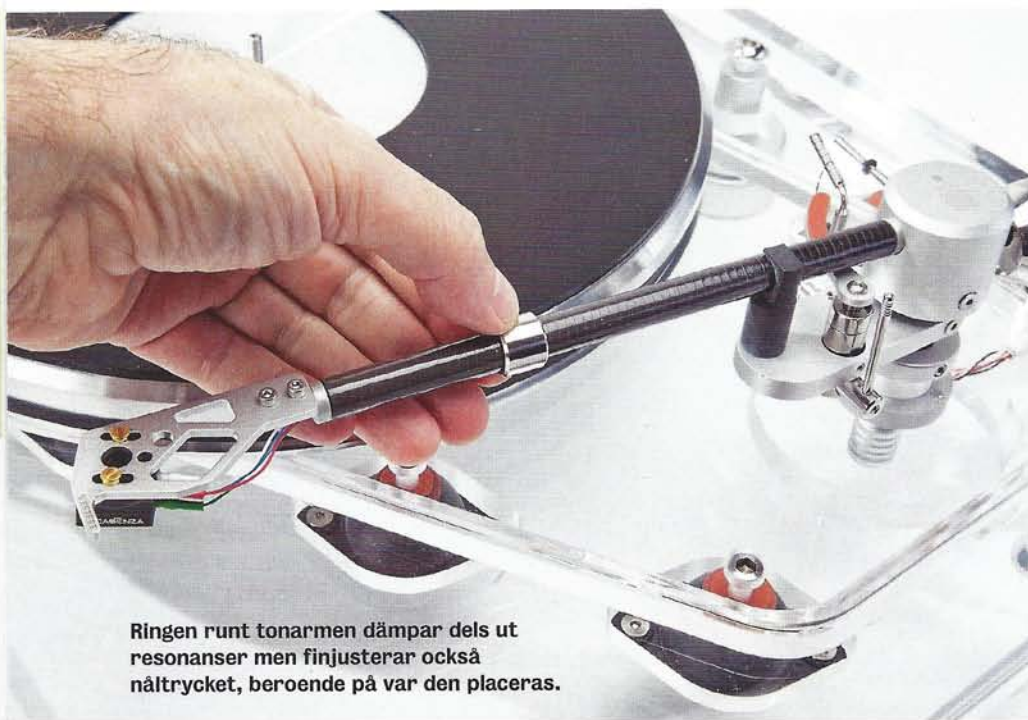
Ringen runt tonarmen dämpar dels ut resonanser men finjusterar också nåltrycket, beroende på var den placeras.