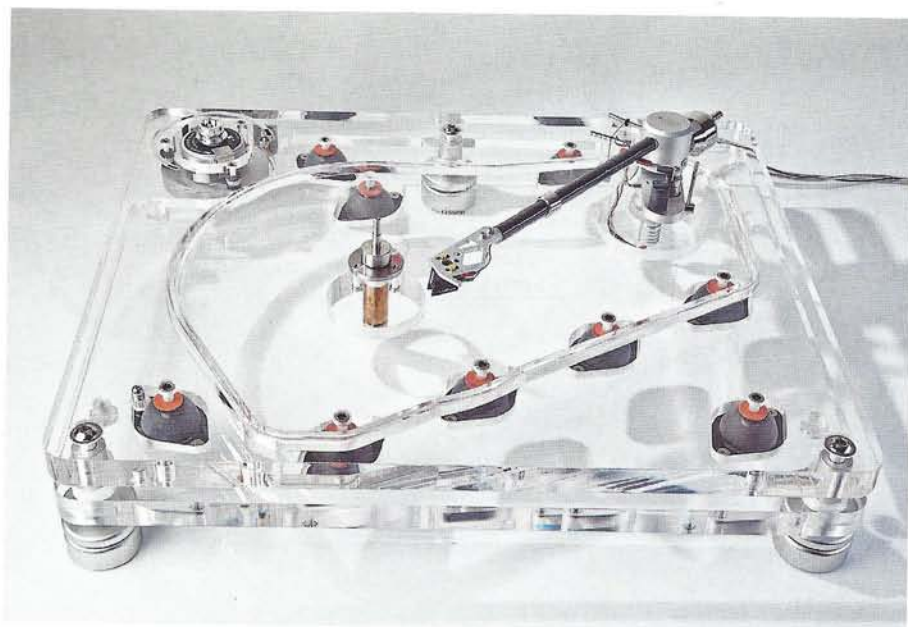
Hela spelaren är uppbyggd på tre individuellt, svagt avfjädrade plexiglasplattor.