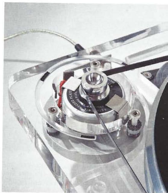
Höger: Motorn är avfjädrad och kan vrida sig en aning kring sin egen axel, för att ge den relativt sett lätta tallriken jämnare gång.